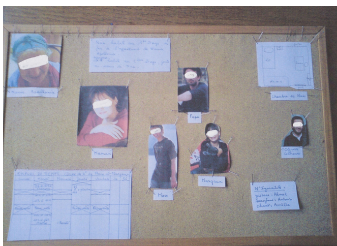
Panneau d'affichage (plans, photos, etc.)