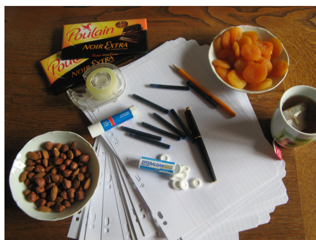
Tout ce qu'il faut pour écrire